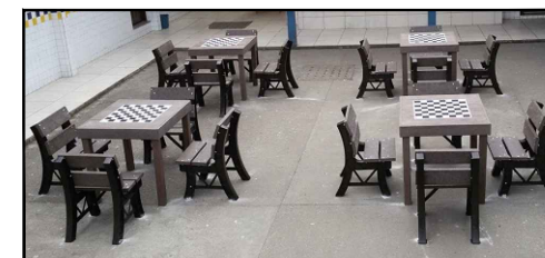
Modelo conjunto de mesa e banquetas*