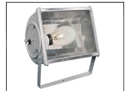
Modelo de refletor*