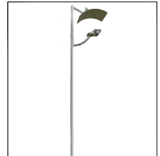
Modelo de luminária - poste metálico*