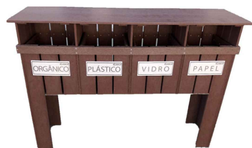
Modelo lixeiro de coleta seletiva*