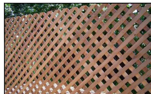
Modelo divisória/jardim vertical*