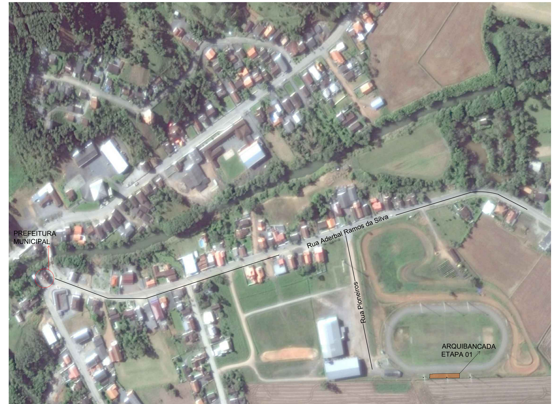
2 MAPA- LOCALIZAÇÃO DA EDIFICAÇÃO SEM ESCALA

Coordenadas UTM: 650548.02 m E e 7043657.24 m S