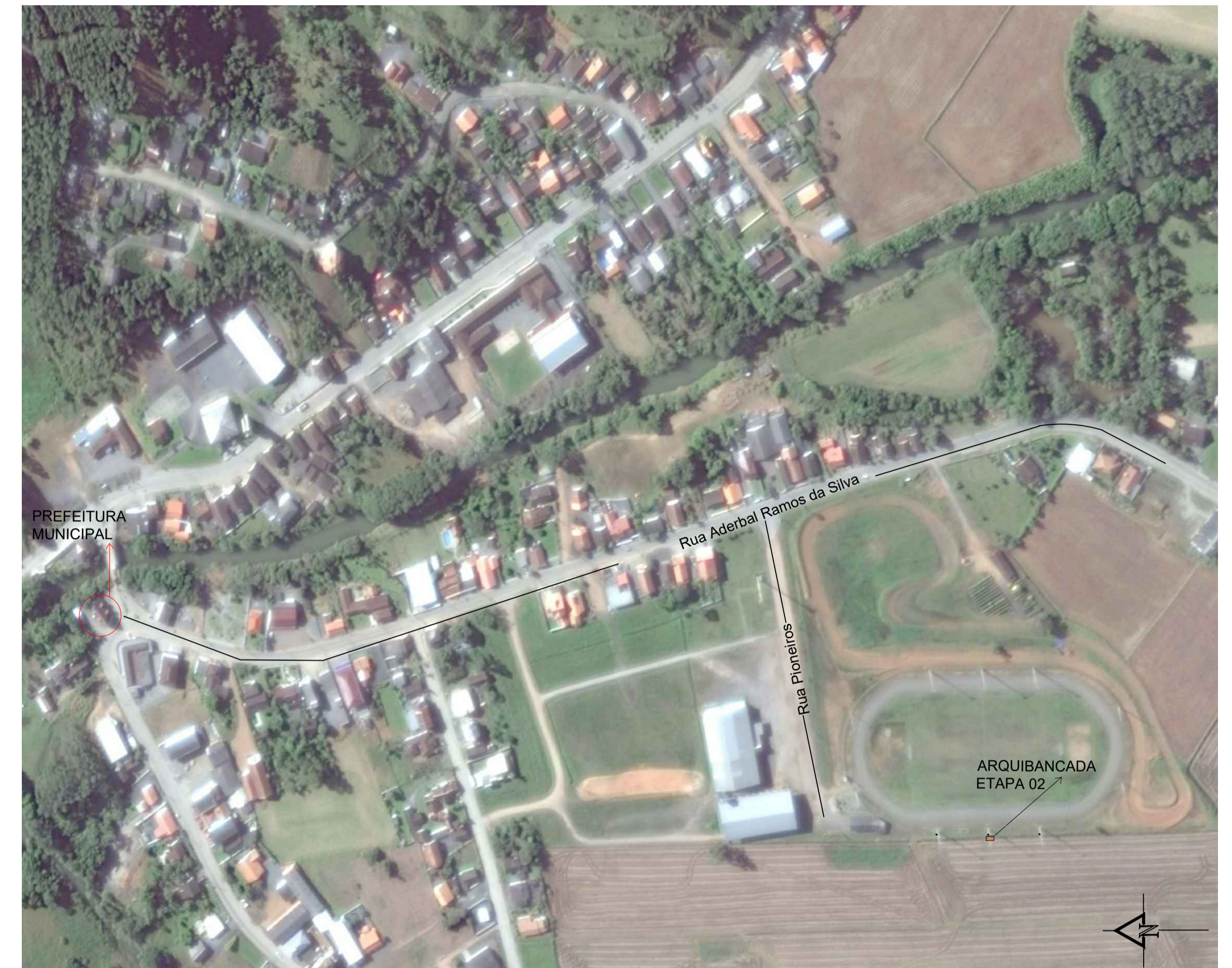
2 MAPA- LOCALIZAÇÃO DA EDIFICAÇÃO SEM ESCALA

Coordenadas UTM: 650548.02 m E e 7043657.24 m S