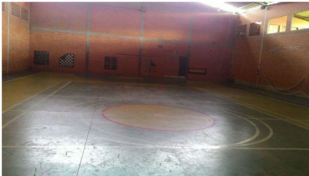
Imagem 03: Situação atual da quadra.

O relatório fotográfico abaixo, tem como objetivo, mostrar as condições atuais da quadra.