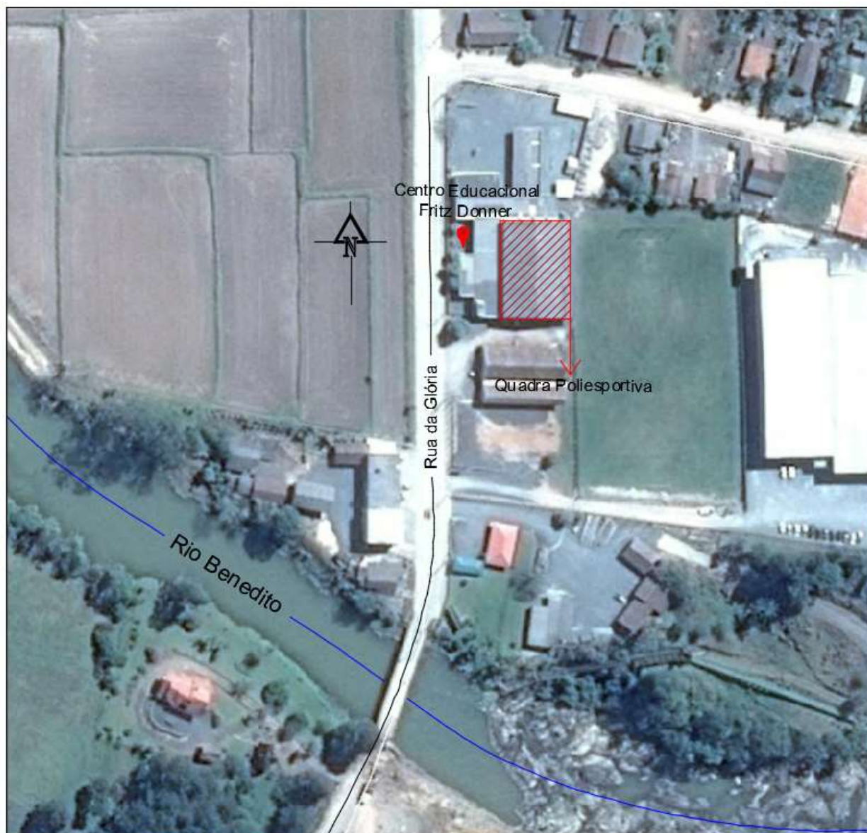
Imagem 02: Localização da quadra.