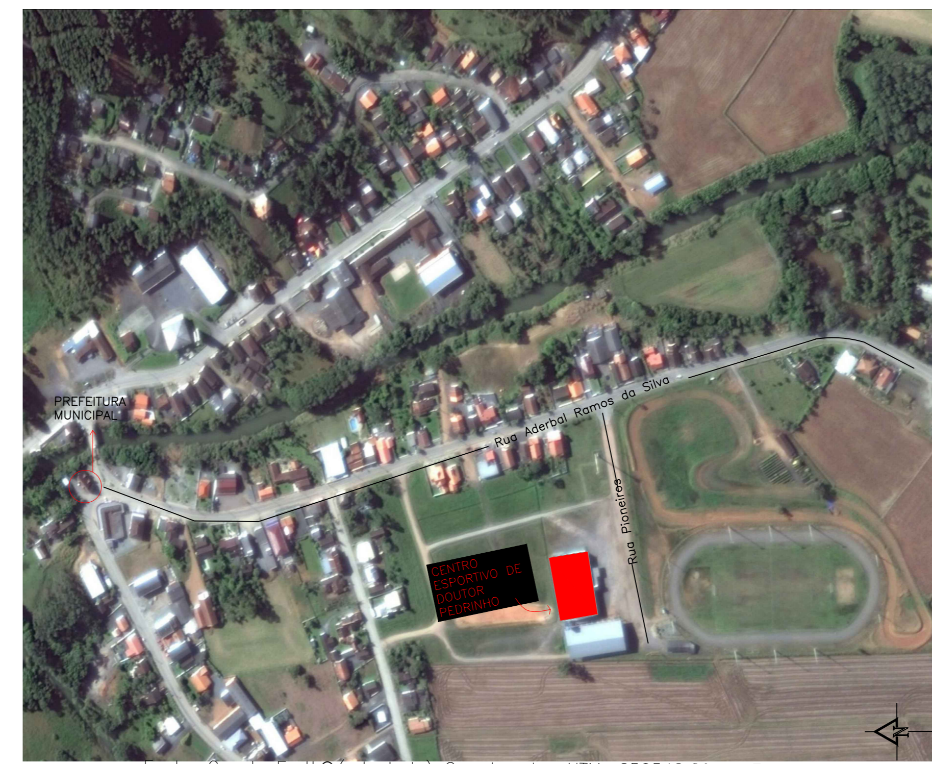
2 MAPA - LOCALIZAÇÃO DO CENTRO ESPORTIVO DE DOUTOR PEDRINHO SEM ESCALA

CENTRO ESPORTIVO DE DOUTOR PEDRINHO - DISTANTE 681m DA PREFEITURA MUNICIPAL DE DOUTOR PEDRINHO