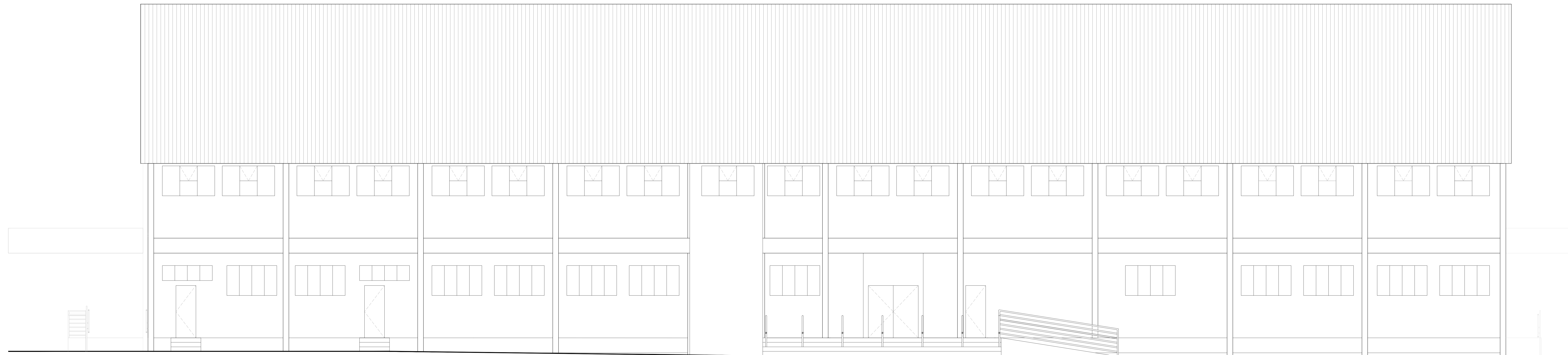
1 VISTA 01 ESCALA 1:50