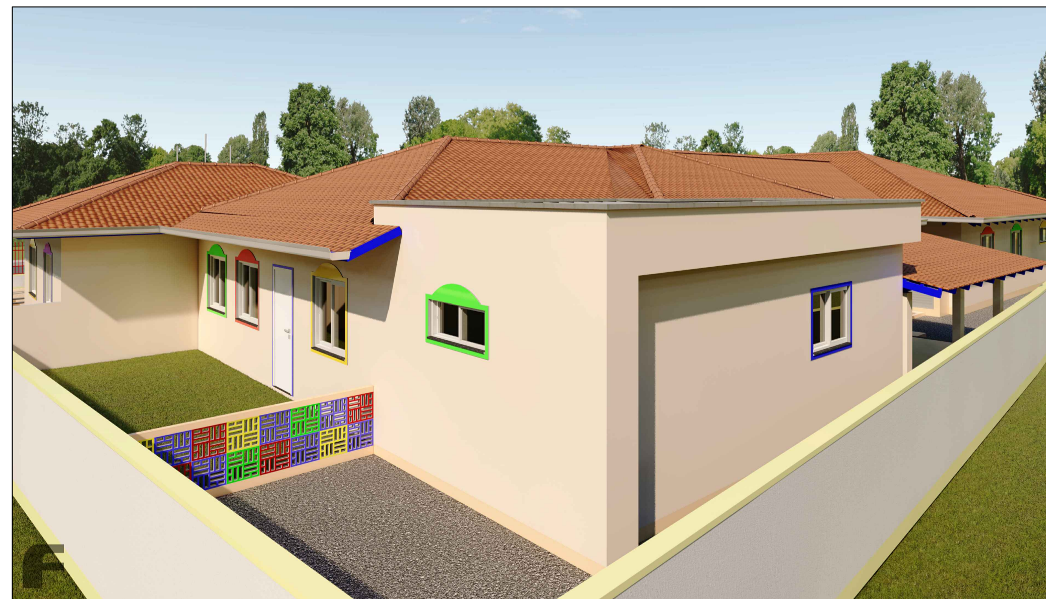
ELEVAÇÃO - 10