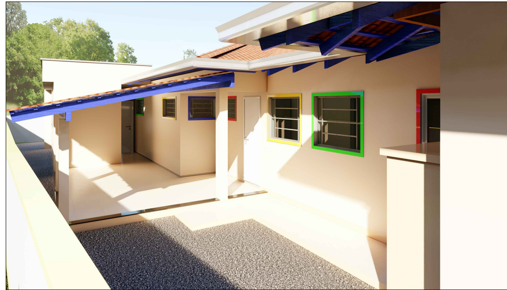
ELEVAÇÃO - 07