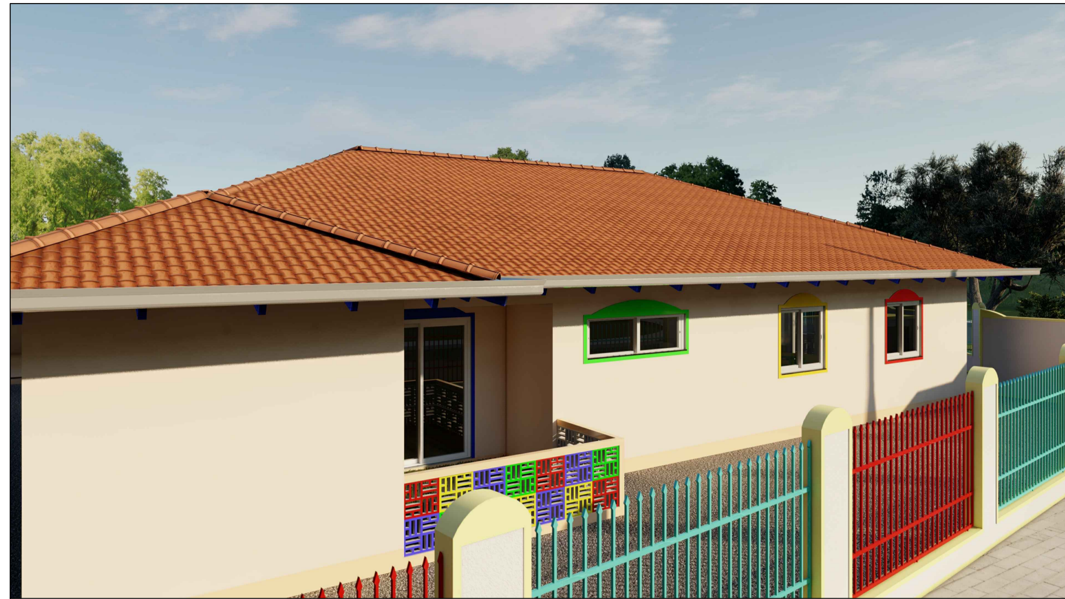
ELEVAÇÃO - 06