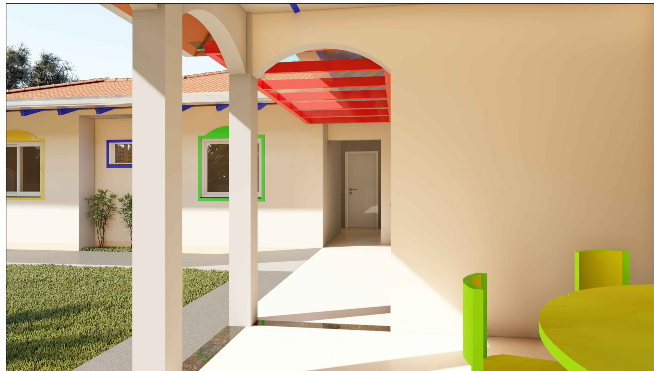
ELEVAÇÃO - 08