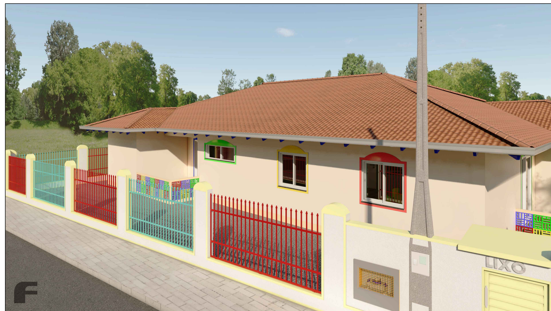
ELEVAÇÃO - 09