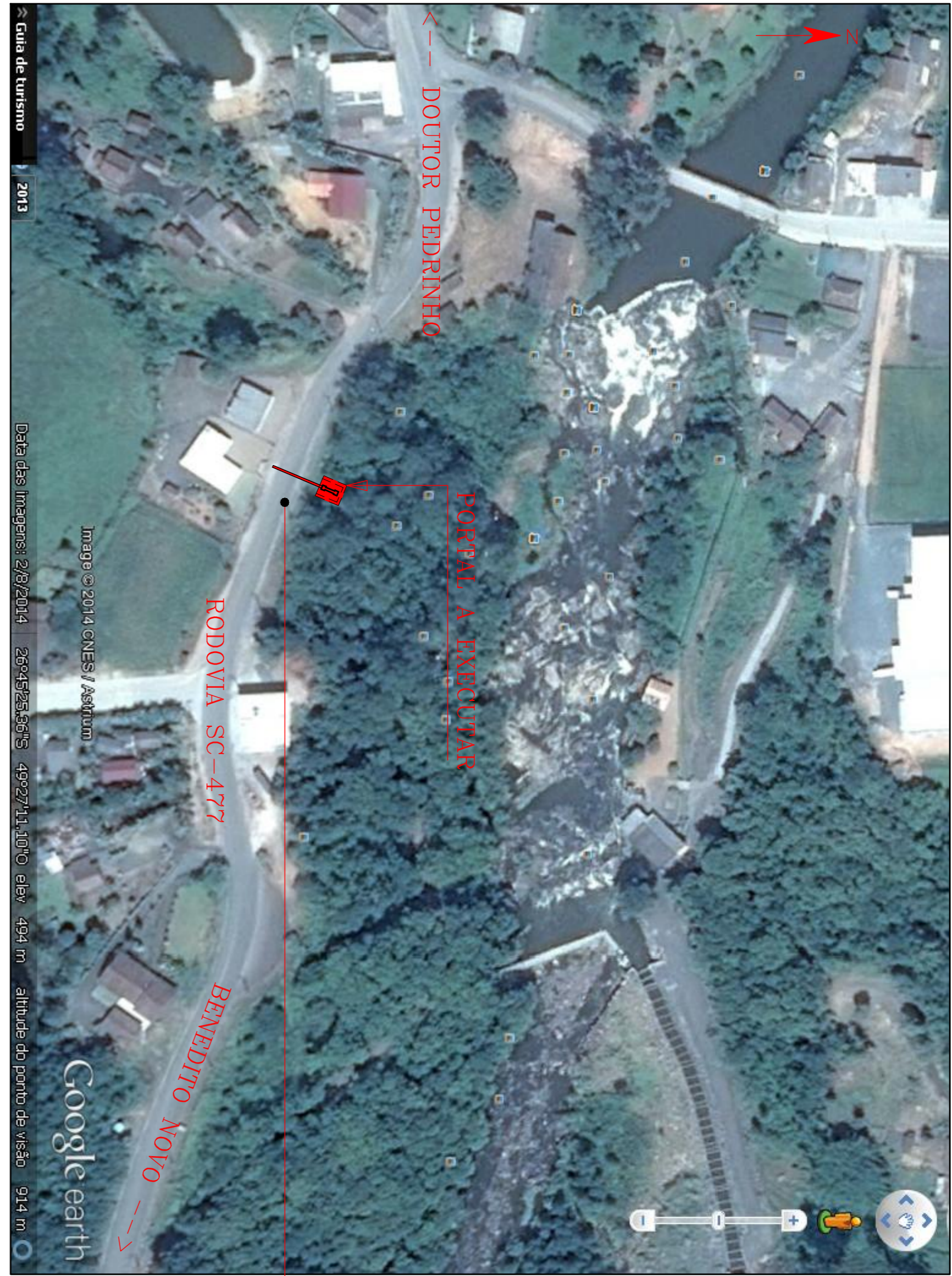
IMAGEM GOOGLE EARTH - LOCALIZAÇÃO