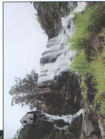
CASCATA SALTO DONNER 02

Neste clima de receptividade a farta gastronomia é servida ao ar livre em meio à natureza. Servidos pratos caseiros elaborados com muito amor pela família. A propriedade possui duas opções, o almoço e o café da tarde.