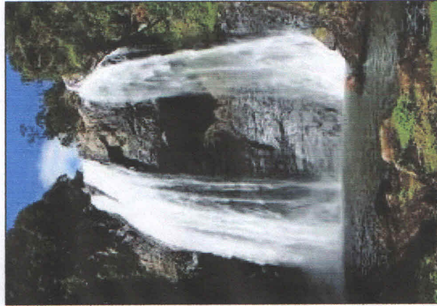
CACHOEIRA VÉU DA NOVA

Com uma distância de 10 km do centro da cidade, a cachoeira Véu da Nova possui uma queda de aproximadamente 63 metros, situa-se em local de rara beleza natural, sendo visitada por muitas pessoas, amantes da natureza, nos finais de semana. O acesso é pela Rodovia Municipal DPE 030 ensaiada que liga o centro da cidade a localidade de Campina. Aproximadamente, a um 1 km da cachoeira, o percurso é feito a pé e por caminho circundado por mata virgem até o local, empolgando o espírito do visitante. Fonte: Prefeitura Municipal