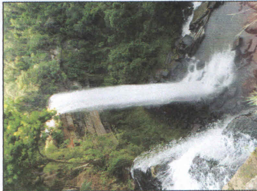
CACHOEIRA PAULISTA FONTE: http://www.doutorpedrinho.com.br

A 15 km do centro, a cascata Alto Capivari, popularmente conhecida como "Cachoeira Paulista", possui uma queda de 40 metros e situa-se na margem direita da rodovia municipal DPE 465 que liga Capivari a Alto Capivari, que dá acesso natural à parte superior da cascata. Fonte: Prefeitura Municipal